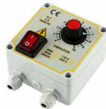
PLASTIC BOX PV R3FCX Z2 STD 100x100x50