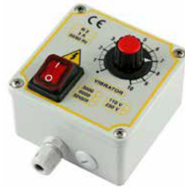
METALLIC BOX PV R3FCX Z2 STM 100x100x50