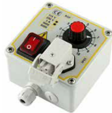
METALLIC BOX PV R3FCX Z2 SM1 100x100x50